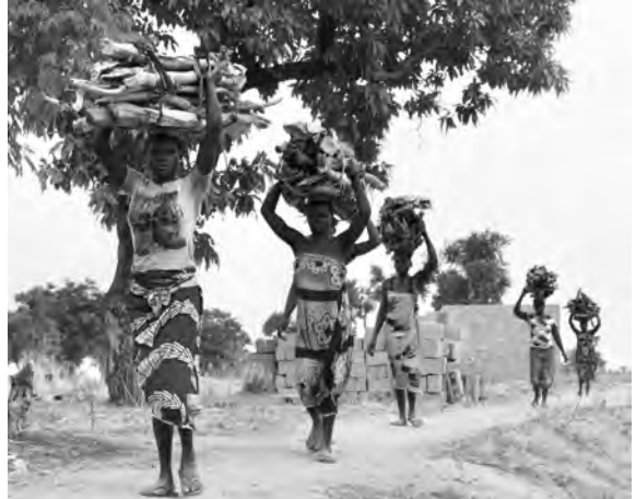
Frauen tragen Feuerholz von weit her.

Für die Vorbereitungsgruppe Silvia Patscheider