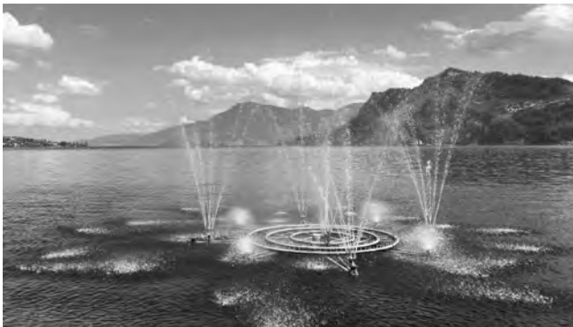
Ausblick von der Glasi über den Vierwaldstättersee

Besuch der Glasfabrik Hergiswil, anschliessend Wanderung nach Horw, wo wir am See grillieren. Der Weg führt weiter auf die andere Seite der Halbinsel Kastanienbaum nach St. Niklausen und eventuell bis nach Luzern. Details siehe Flyer oder Homepage.