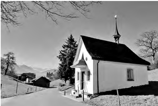
Die zierliche Kapelle Maria zur guten Wende dürfte im 17. Jh. erbaut worden sein.

In uralter Zeit, als die Waldstätte mit den Habsburgern im Krieg lagen, soll hier ein Wegelagerer sein Unwesen getrieben haben. Er soll durchziehende Pilger, Kaufleute und Handwerker ermordet und ausgeraubt und die Opfer im sumpfigen Umland der Kapelle verschwinden lassen haben. So kam dieses Gebiet zu seinem heute vergessenen Namen „Blutried“. Bewaffneten